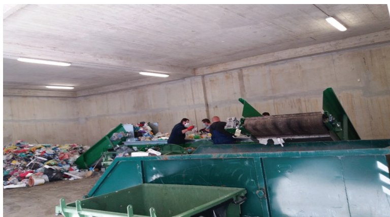
Slika 6. Prikaz sortirnice u Gradu Malom Lošinju