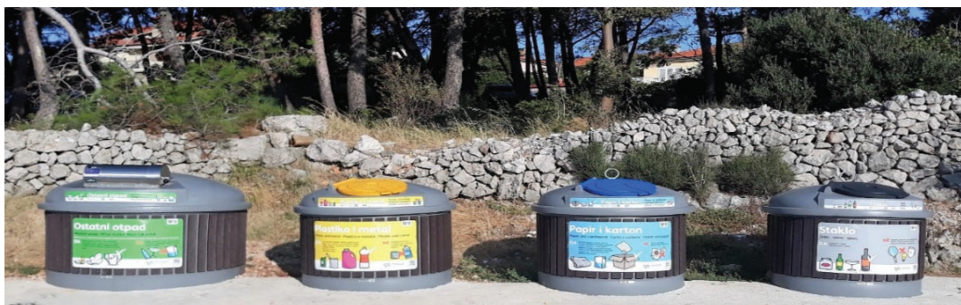
Slika 1. Posebno označeni spremnici za odvojeno sakupljanje otpada

U zeleni spremnik odlaže se miješani komunalni otpad, u žuti spremnik odlaže se plastika i metal, u plavi spremnik: papir, karton, višeslojna kartonska ambalaža te u sivi spremnik: staklo (Slika 1. )