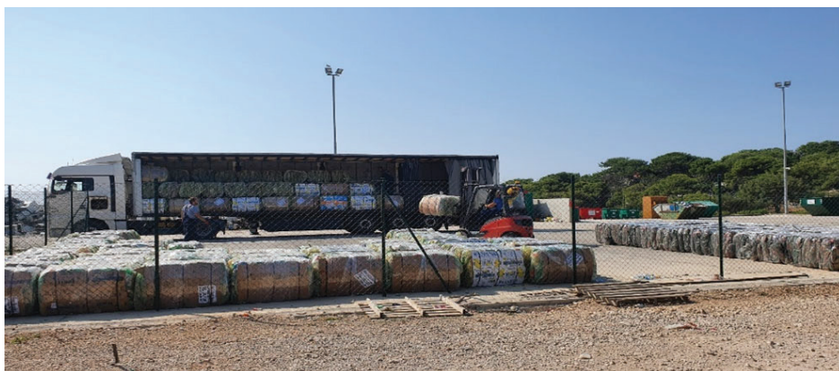
Slika 3. Prikaz sortirnice u Gradu Malom Lošinj

Predaja otpada daljnjim otkupiteljima – kada su svi prethodni koraci ispunjeni, balirani otpad daje se ovlaštenim sakupljačima takvih vrsta otpada.