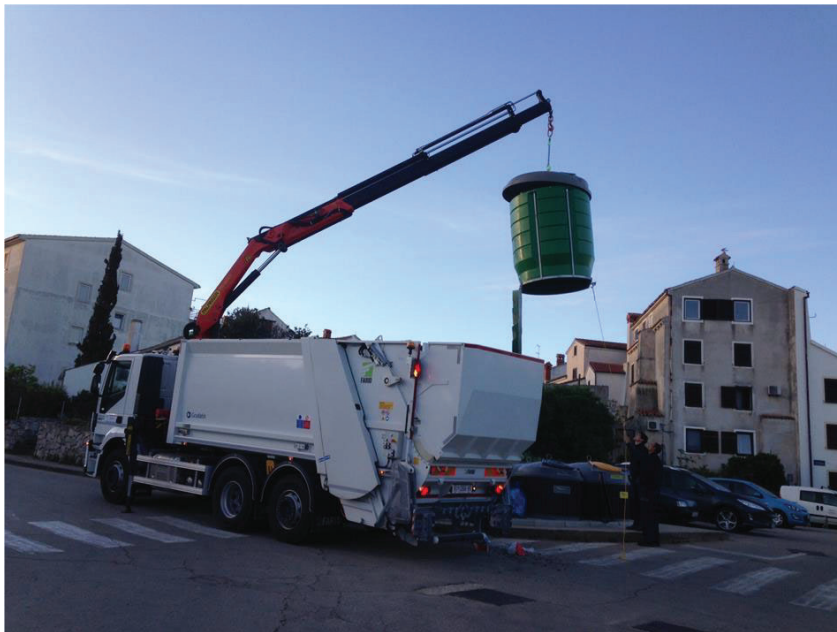
Slika 2. Prikaz sakupljanja otpada iz polupodzemnih spremnika u Gradu Mali Lošinj

Sljedećim tablicama prikazane su količine prikupljenog miješanog komunalnog otpada na području Grada Malog Lošinja za 2023. godinu (zasebno za otoke Ilovik, Susak, Unije i Srakane te ostala naselja Grada Malog Lošinja)