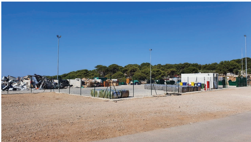
Slika 11: Reciklažno dvorište Grada Malog Lošinja