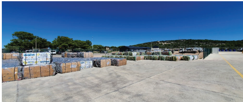
Slika 4. Prikaz sortirnice u Gradu Malom Lošinju