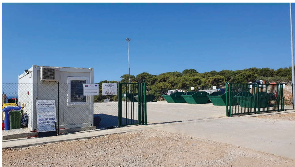
Slika 10: Reciklažno dvorište Grada Malog Lošinja