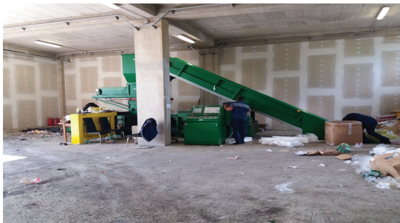
Slika 5. Prikaz sortirnice u Gradu Malom Lošinju