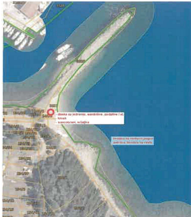
Luka Nerezine (izvan lučkog područja – desno od istočnog gata)