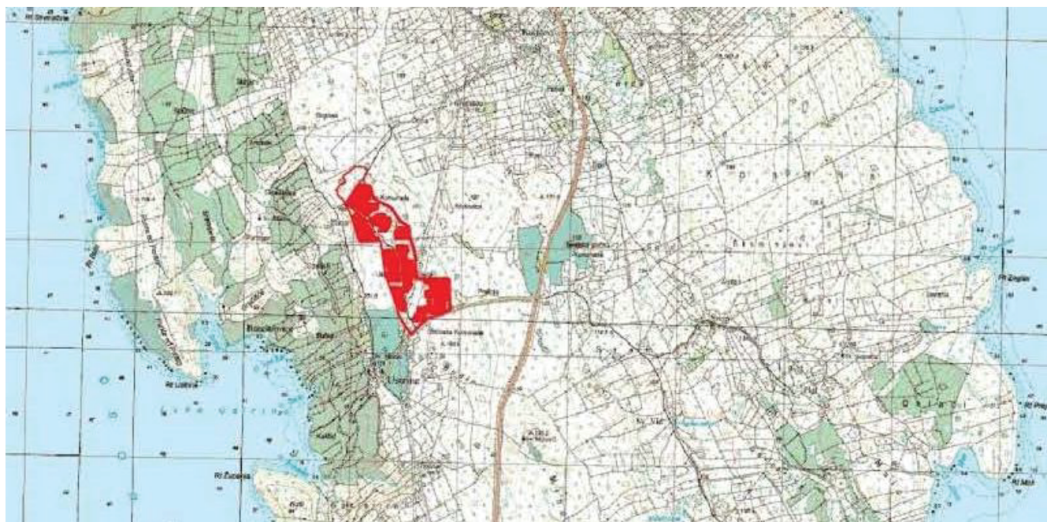
LOKACIJA SE USTRINE

Visokonaponska postrojenje AIS (otvorenog tipa), približne površine 7.878 m 2 na k.č. br. 6613/4 k.o. Čunski.