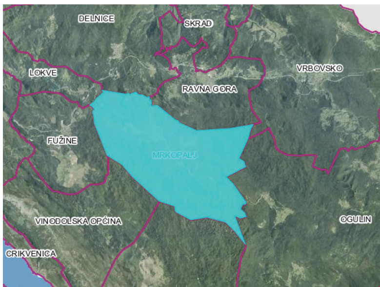
Slika 1. Lokacija Općine Mrkopalj na području Primorsko-goranske županije

Zakonom o područjima županija, gradova i općina u Republici Hrvatske („Narodne novine“, broj 86/06, 125/06, 16/07, 95/08, 46/10, 145/10, 37/13, 44/13, 45/13 i 110/15) određeno je područje Općine Mrkopalj.