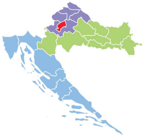
Slika 1. Nove statističke regije Republike Hrvatske