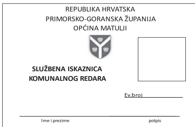
Slika 2 stražnja strana iskaznice komunalnog redara