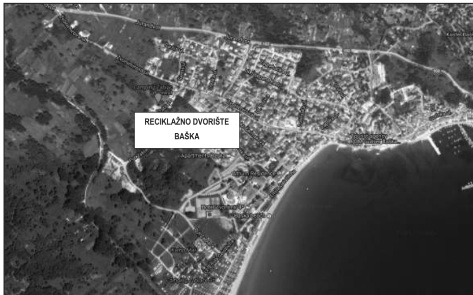
SLIKA 2: LOKACIJA RECIKLAŽNOG DVORIŠTA BAŠKA

Reciklažno dvorište Baška nalazi se na k.č. 2945, k.o. Baška i površine je 2.155 m 2 . U reciklažnom dvorištu prikupljaju se sve vrste otpada u skladu s Dodatkom IV. Pravilnika o gospodarenju otpadom (NN 117/17).