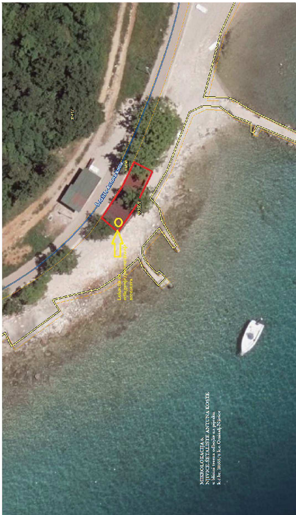
MIKROLOKACIJA 6. NIVICE-SETALISTE ANTUNA KOSTE u blizini terena odbojke na pijesku k.č.br. 10655/8 Lc. Omasalj-Njivice