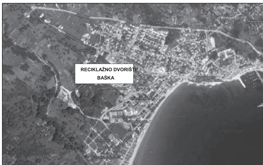
SLIKA 2: LOKACIJA RECIKLAŽNOG DVORIŠTA BAŠKA

Reciklažno dvorište Baška nalazi se na k.č. 2945, k.o. Baška i površine je 2.155 m 2 . U reciklažnom dvorištu prikupljaju se sve vrste otpada u skladu s Dodatkom IV. Pravilnika o gospodarenju otpadom (NN 117/17).