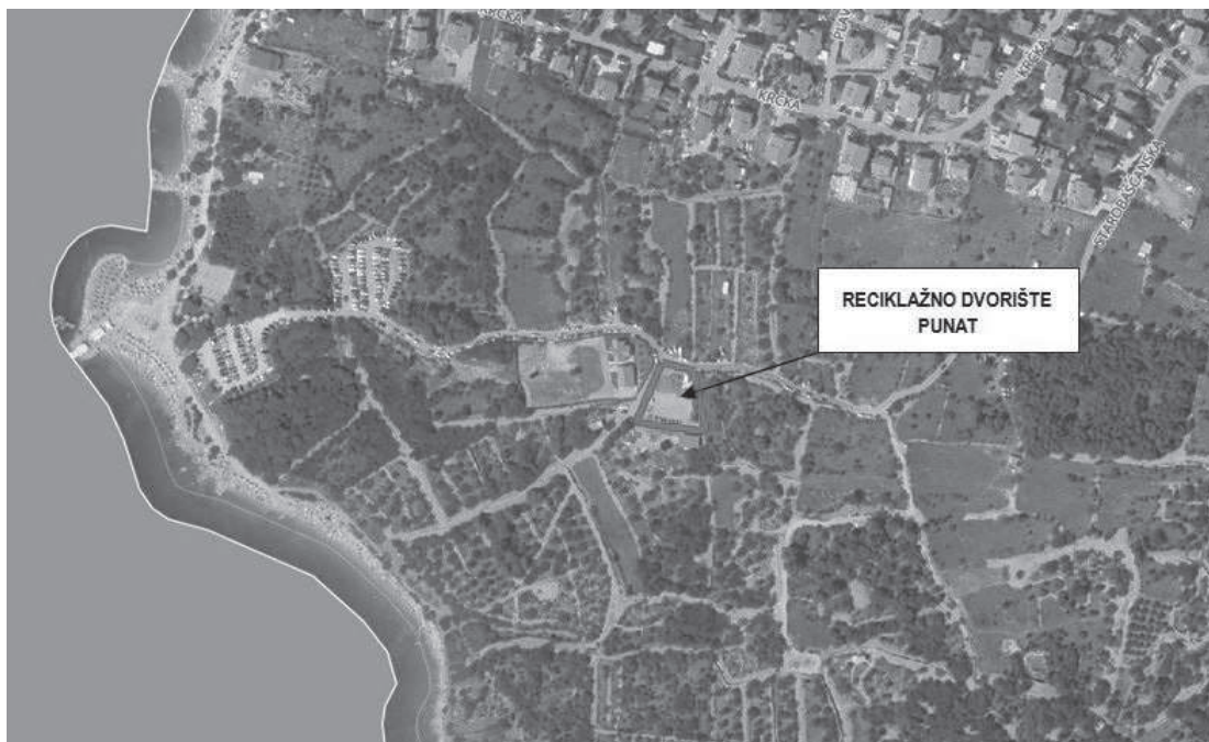
Slika 2. : Lokacija trenutnog reciklažnog dvorišta Punat

Reciklažno dvorište Punat nalazi se na k.č. 5088/4 k.o. Punat i površine je 1.035,00 m 2 . U reciklažnom dvorištu prikupljaju se sve vrste otpada u skladu s Dodatkom IV. Pravilnika o gospodarenju otpadom (NN 117/17).