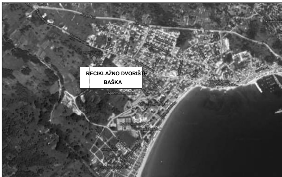
SLIKA 2: LOKACIJA RECIKLAŽNOG DVORIŠTA BAŠKA

Reciklažno dvorište Baška nalazi se na k.č. 2945 k.o. Baška i površine je 2.155 m 2 . U reciklažnom dvorištu prikupljaju se sve vrste otpada u skladu s Dodatkom IV. Pravilnika o gospodarenju otpadom ("Narodne novine" broj 117/17).