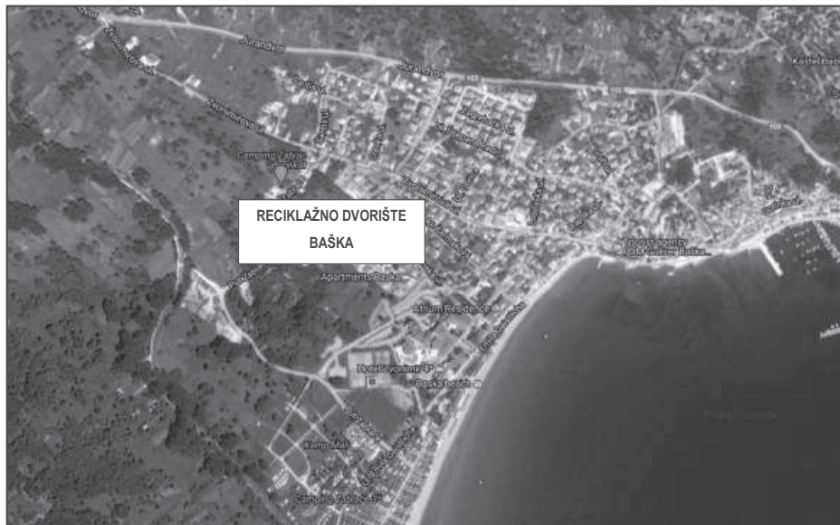
SLIKA 2: LOKACIJA RECIKLAŽNOG DVORIŠTA BAŠKA

Reciklažno dvorište Baška nalazi se na k.č. 2945, k.o. Baška i površine je 2.155 m 2 . U reciklažnom dvorištu prikupljaju se sve vrste otpada u skladu s Dodatkom IV. Pravilnika o gospodarenju otpadom (NN 117/17).